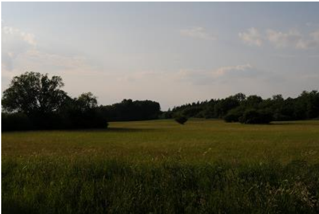
Nagyobb kiterjedésű üde kaszálórét a Tengelici rétek SCI területén.