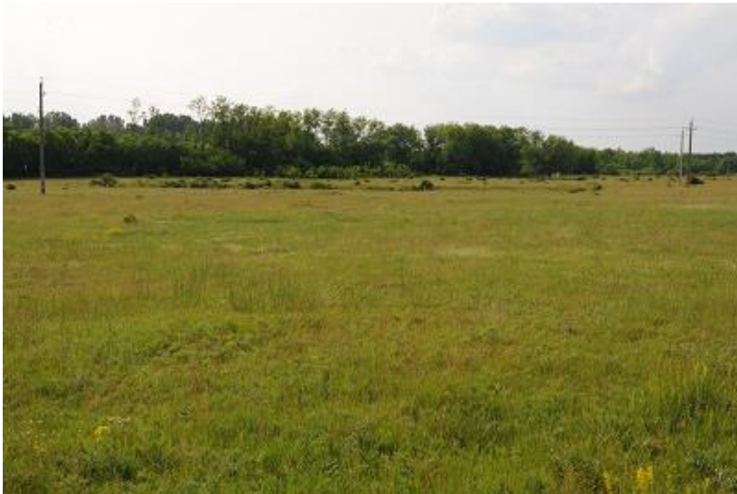
Nagyobb kiterjedésű, enyhén legeltetett üdébb gyepek a Paksi ürgemező délnyugati részén.