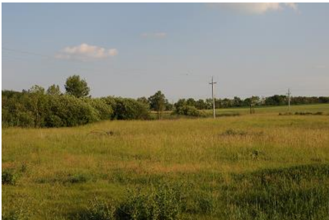
Kisebb üde rétfolt a Tengelici rétek SCI közvetlen környezetében.