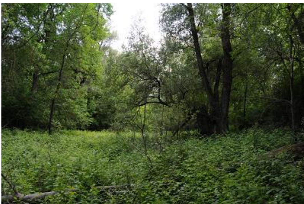
A 2.b mintavételi kvadrát az első mintavételkor.