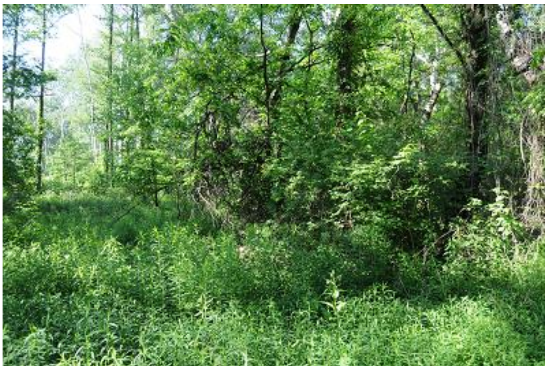
A 6. mintavételi kvadrát az első mintavételkor.