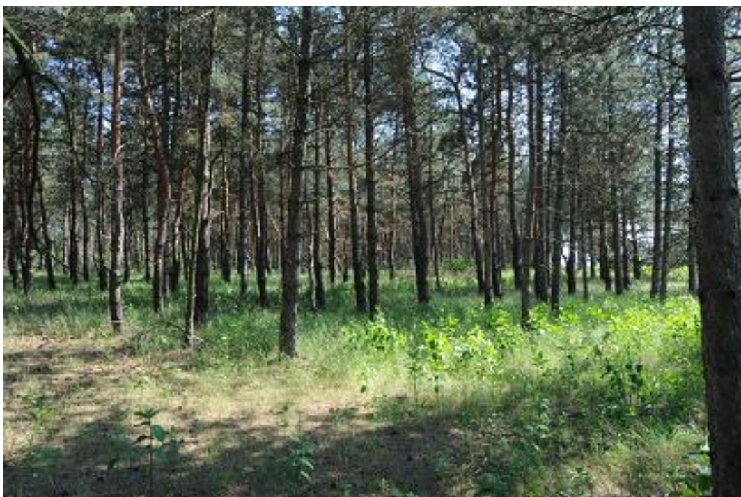
A 4. mintavételi kvadrát az első mintavételkor.