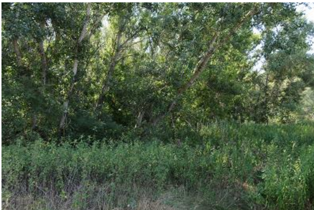
A 2.a mintavételi kvadrát a második mintavételkor.