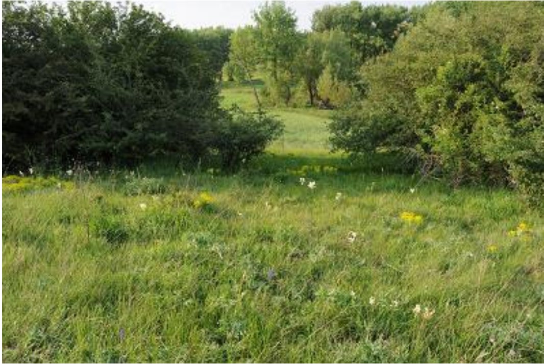
Igen kis kiterjedésű, üdébb, de bokrosodó löszgyep-folt a Vörösmalom-völgy középső részén (Közép-mezőföldi löszvölgyek SCI).