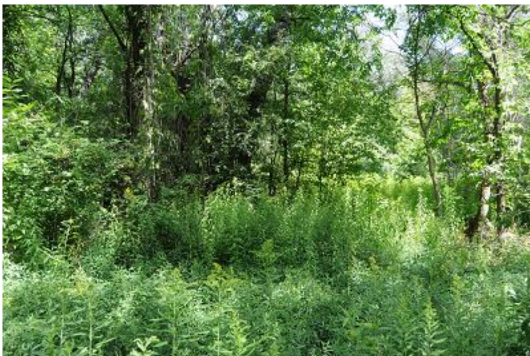
A 6. mintavételi kvadrát a második mintavételkor.