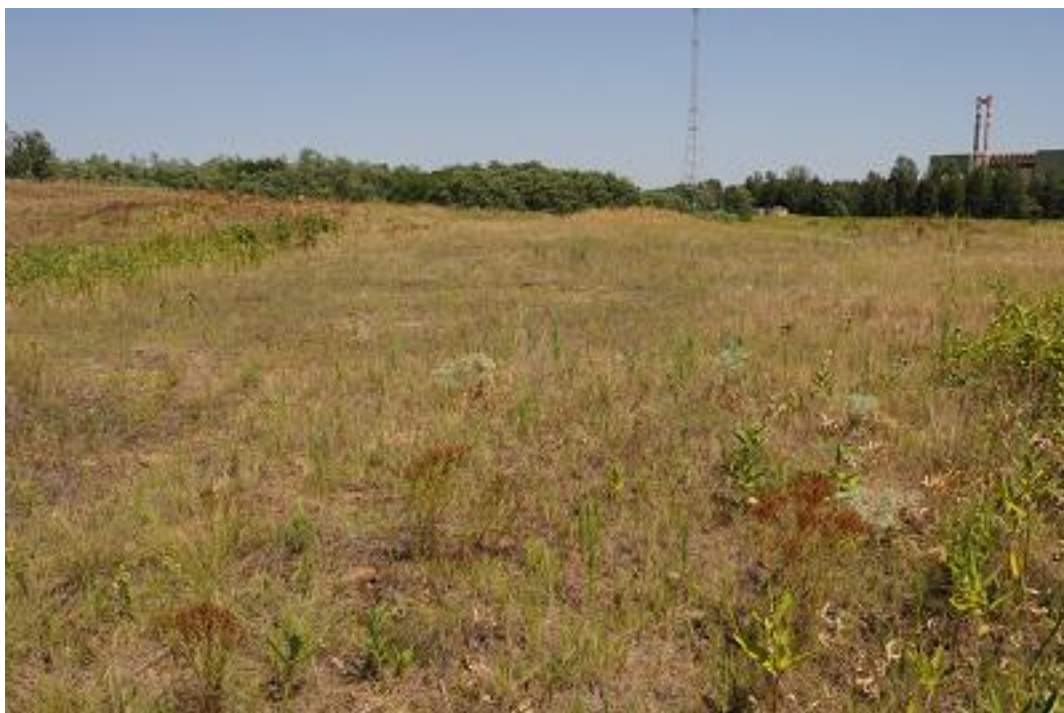
Az 5. mintavételi kvadrát a második mintavételkor.