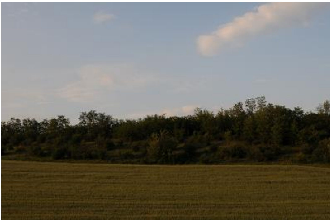
A Paksi tarkasáfrányos SCI-n belüli gabonátábla, mellette löszgyepes völgyoldal erősen bokrosodó állapotban.