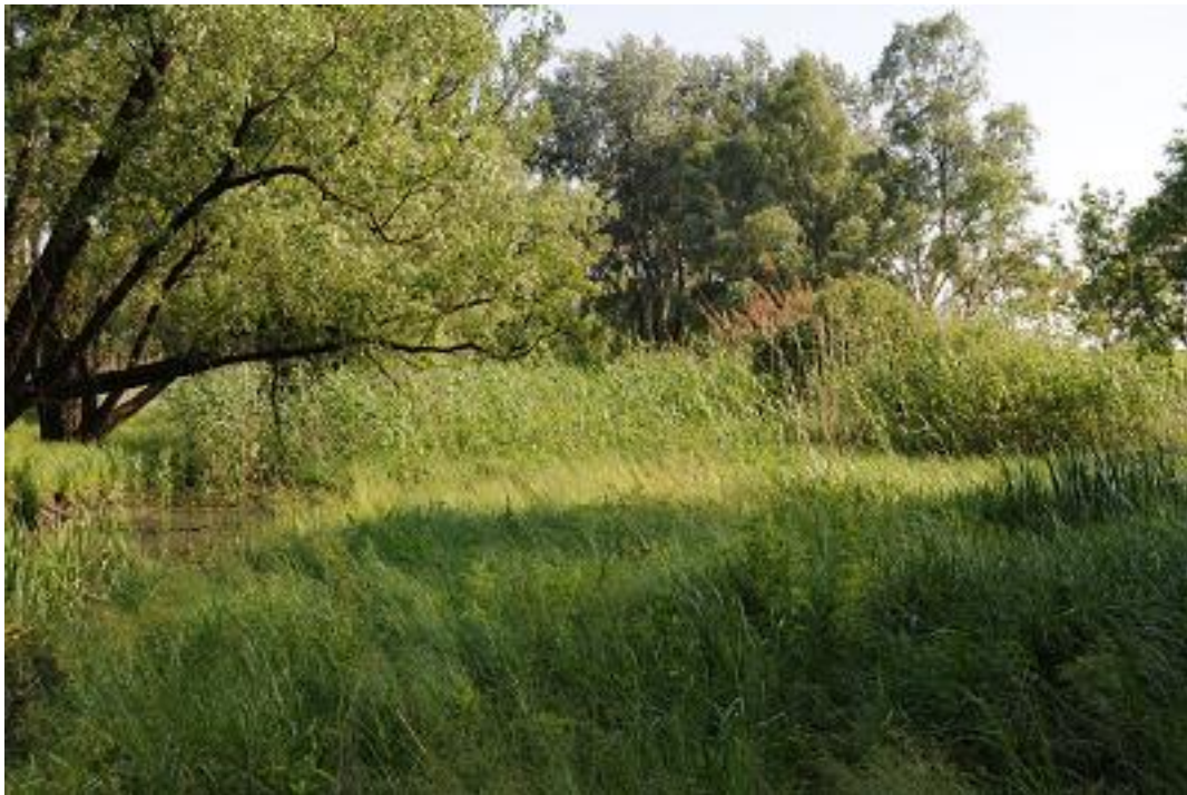
Nádasodásnak indult üde rétfolt a Dunaszentgyörgyi láperdő SCI területén.