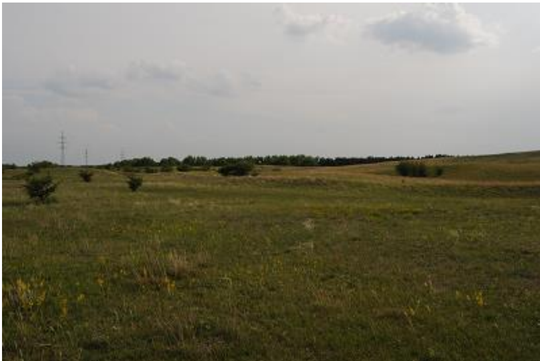
Homokpusztába ékelt mélyebb fekvésű, kisebb üdébb gyepfolt a Paksi ürgemezőn.