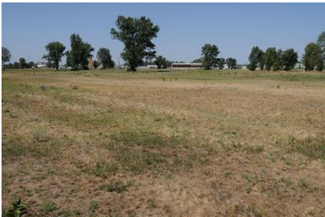
A 3. mintavételi kvadrát a második mintavételkor.