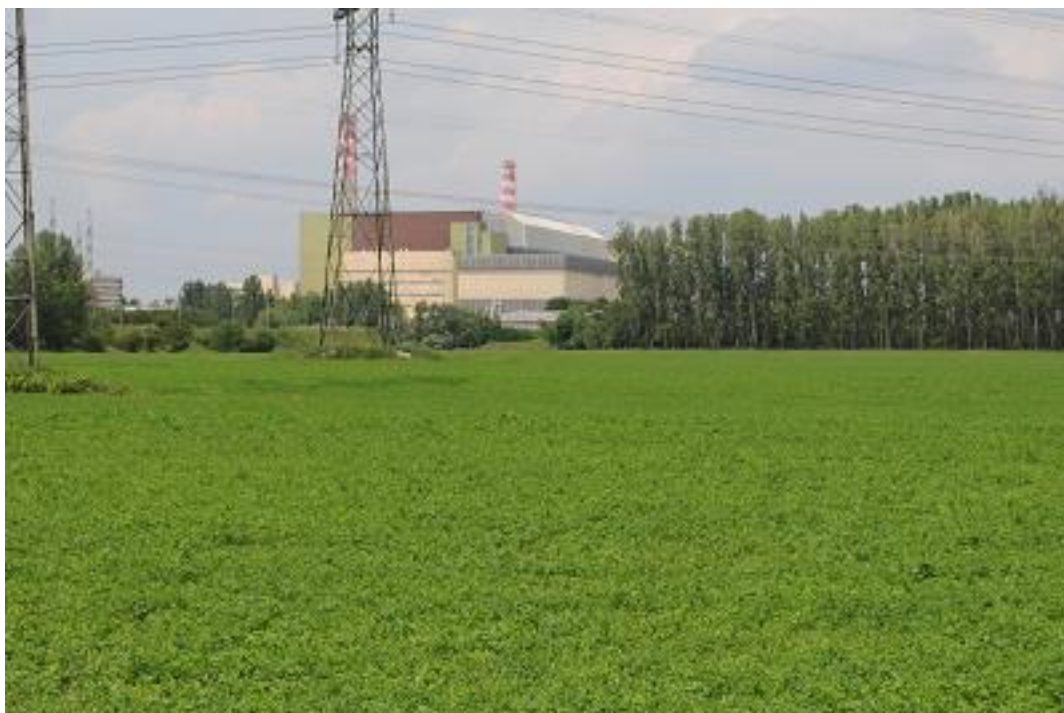
Az 1. mintavételi kvadrát az első mintavételkor.