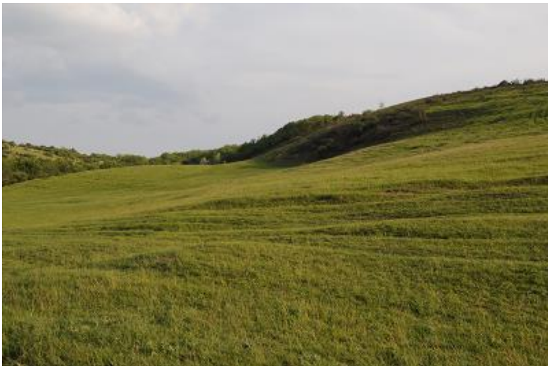
Nagy kiterjedésű, intenzíven használt löszgyepes völgyoldal a Vörösmalom-völgy déli részén (Közép-mezőföldi löszvölgyek SCI).