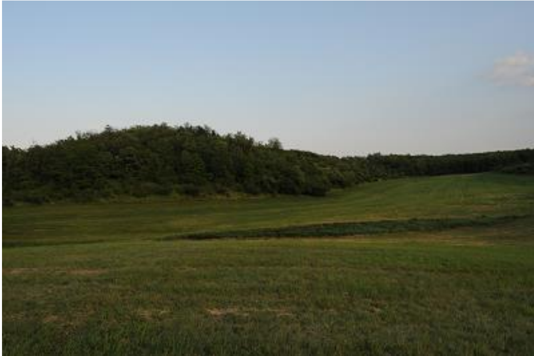
A Paksi tarkasáfrányos már erdőszült egykori löszgyepjei, mellettük kaszált, feltehetően felülvetett gyepes részek.