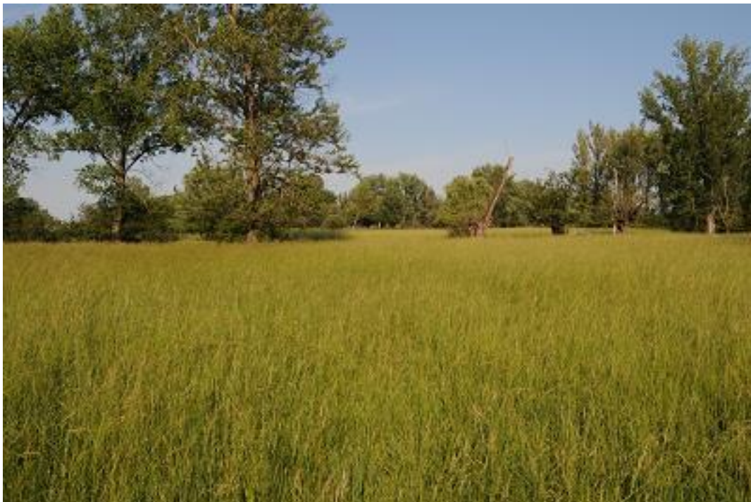
Nagy kiterjedésű üde mocsárét jellemű kaszáló a Dunaszentgyörgyi láperdő SCI területén.