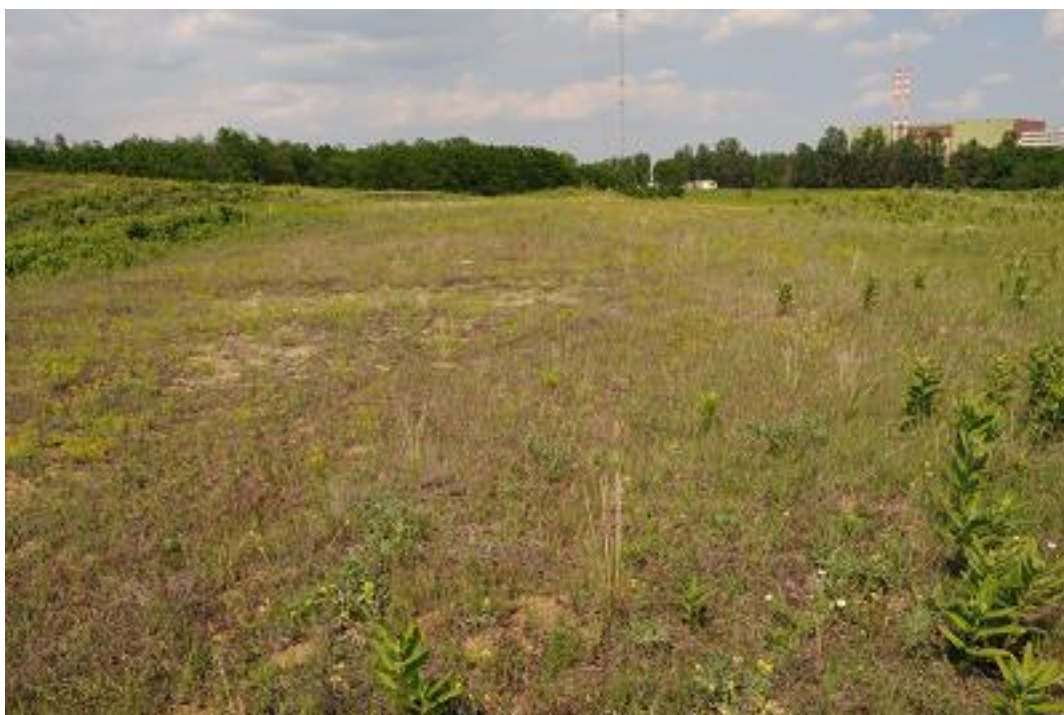
Az 5. mintavételi kvadrát az első mintavételkor.