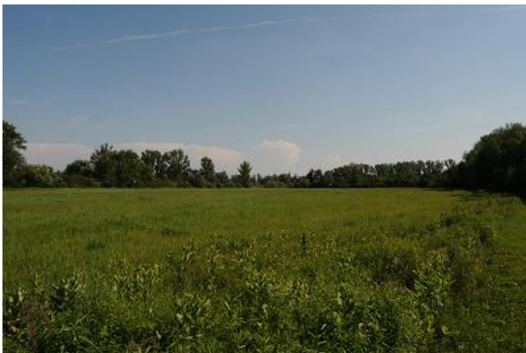
Üde rét jellegű vadföld a Dunaszentgyörgyi Láperdő SCI területén.