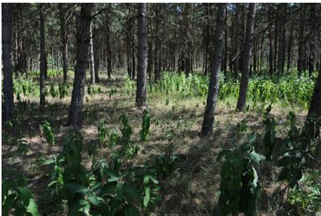
A 4. mintavételi kvadrát a második mintavételkor.