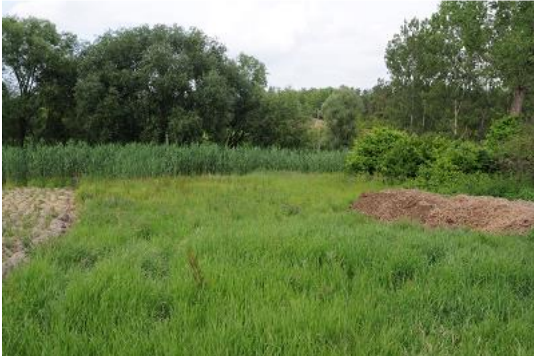
Kis kiterjedésű völgyalji mocsárrét folt a Vörösmalom-völgyben (Közép-mezőföldi löszvölgyek SCI).