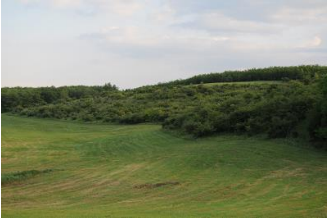
A Paksi tarkasáfrányos jellemző képe, az előtérben és a háttérben kaszált, feltehetően felülvetett gyepek, a domboldal löszgyepje pedig erősen galagonyásodik.