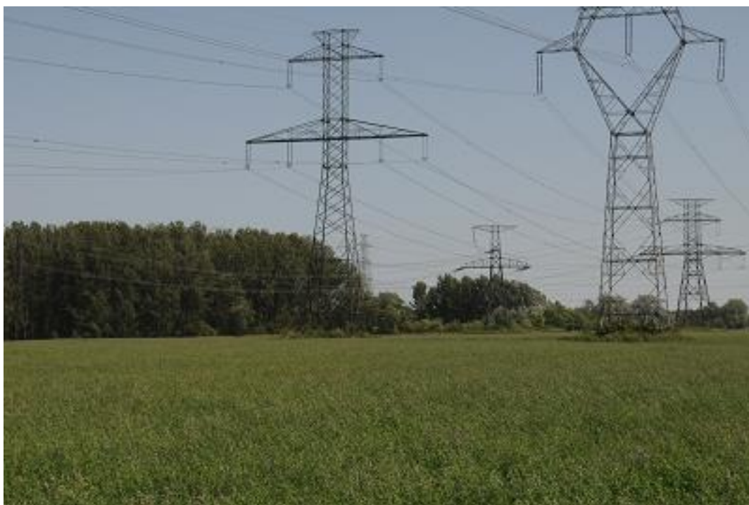
Az 1. mintavételi kvadrát a második mintavételkor.