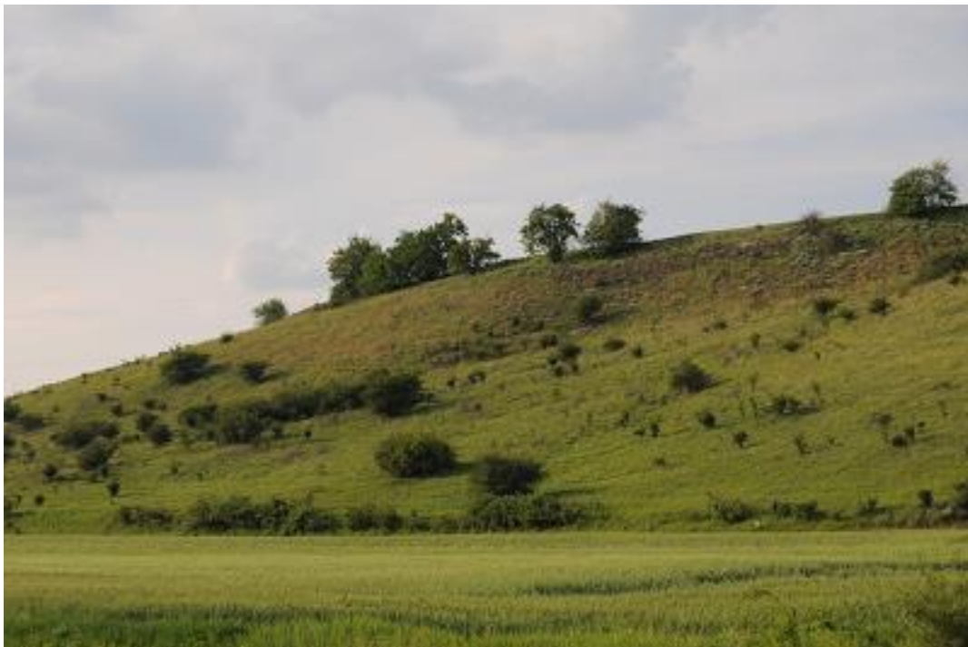
Bokrosodó löszgyepes völgyoldal a völgytalpon gabonátáblával a Vörösmalom-völgyben (Közép-mezőföldi löszvölgyek SCI).